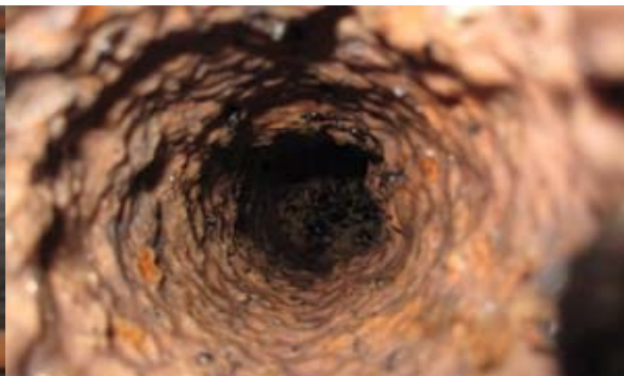
Visste du att vi har 1,5 mil avloppsledningar som nu har fått en välbehövlig genomgång