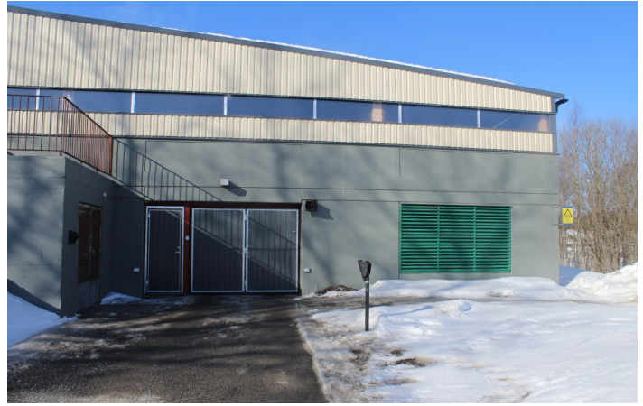
Asfaltering av körbanan i nedre planet påbörjas vecka 19

Du som har bilen i övre planet berörs ej.